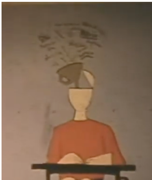
Immagine tratta dal video citato

“La nostra Costituzione è antifascista, si fonda sulla lotta di Liberazione” Sergio Mattarella, Presidente della Repubblica